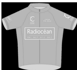
Maillot Vert Leader animateur