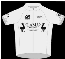
Maillot Jaune Leader Général

WEST-ARC S.A. - Kervidanou 3 B.P.610 - 29396 MELLAC Cédex Tél. 98 96 34 34 - Fax 98 96 34 55