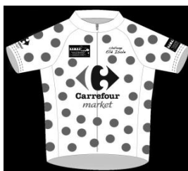
Maillot à Pois Leader Grimpeur