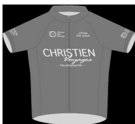
Maillot Bleu Leader 3°/Junior