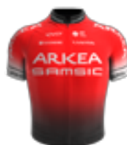
UCI PRO TEAM TEAM ARKEA - SAMSIC FRA