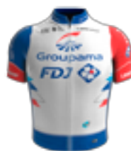
UCI WORLD TEAM GROUPAMA - FDJ FRA