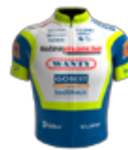
UCI WORLD TEAM INTERMARCHÉ - WANTY - GOBERT MATÉRIAUX BEL