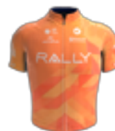
UCI PRO TEAM RALLY CYCLING USA