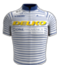
UCI PRO TEAM DELKO FRA