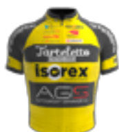
EQUIPE CONTINENTALE UCI TARTELETTO - ISOREX BEL