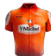
EQUIPE CONTINENTALE UCI ST MICHEL - AUBER 93 FRA