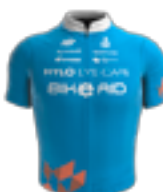
EQUIPE CONTINENTALE UCI BIKE AID GER