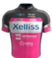
EQUIPE CONTINENTALE UCI XELLISS - ROUBAIX LILLE METROPOLE FRA