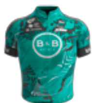
UCI PRO TEAM B&B HOTELS P/B KTM FRA