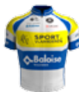
UCI PRO TEAM SPORT VLAANDEREN - BALOISE BEL