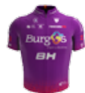
UCI PRO TEAM BURGOS-BH ESP