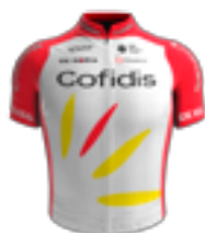
UCI WORLD TEAM COFIDIS FRA