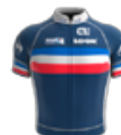
EQUIPE NATIONALE ÉQUIPE DE FRANCE FRA