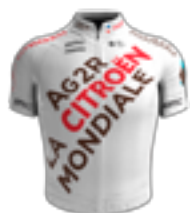
UCI WORLD TEAM AG2R CITROËN TEAM FRA