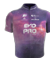
EQUIPE CONTINENTALE UCI EVOPRO RACING IRL