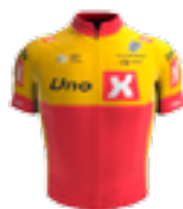
UCI PRO TEAM UNO - X PRO CYCLING TEAM NOR