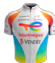
UCI PRO TEAM TOTALENERGIES FRA