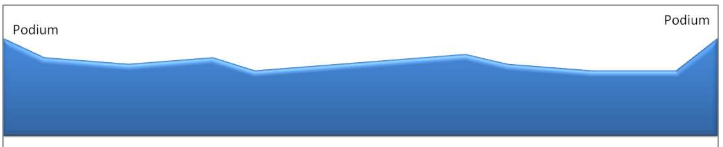
Circuit final D : 4 tours de 8.60 kms