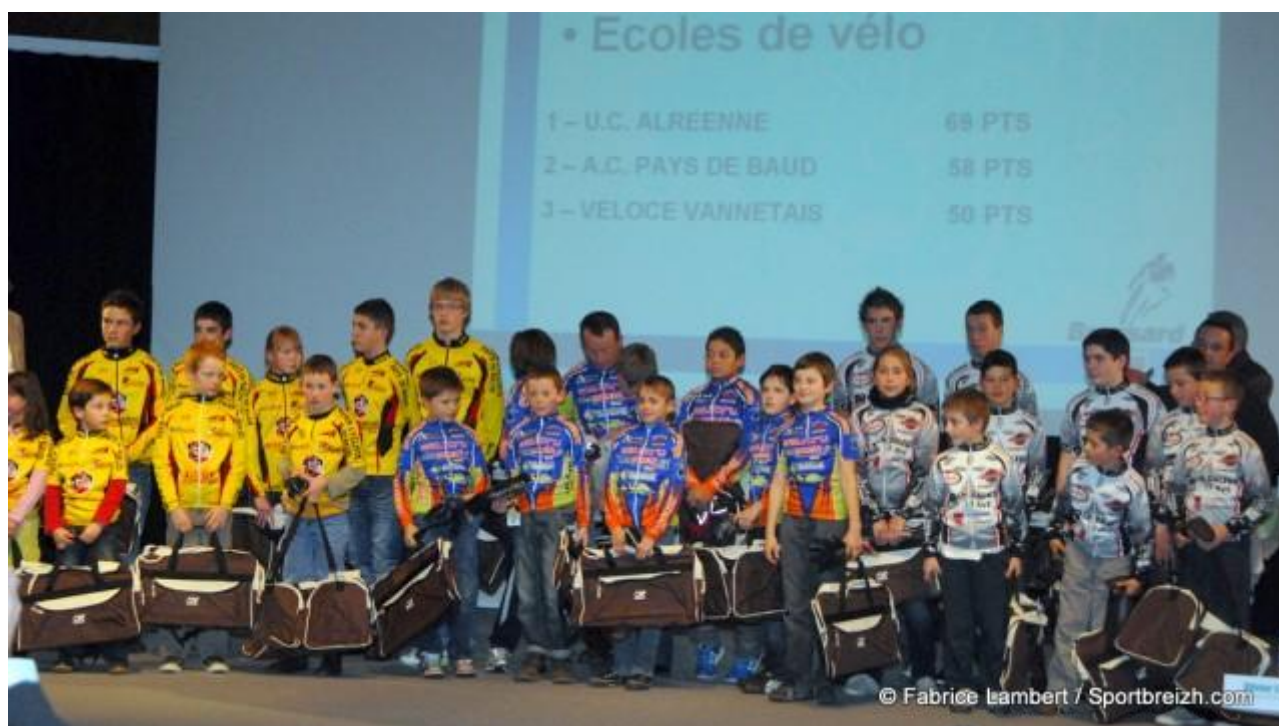
La remise des récompenses 2010 avec les Ecoles de Cyclisme du CD56