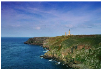
Brittany - Cap Fréhel

C'est l'un des plus beaux paysages maritimes de France ! Le Cap Fréhel, situé à quelques encablures de la ligne d'arrivée (à Fréhel Plage), offre un incroyable panorama sur la Manche, depuis la Baie de Saint-Brieuc jusqu'à Saint-Malo et Granville.