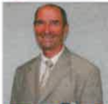
René DURAND Circuit