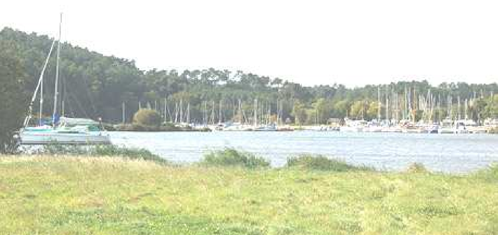
Port du Foleux, visible du parcours