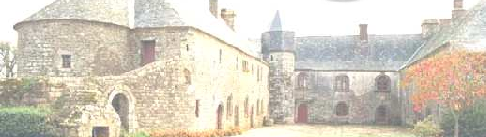
Le Vieux Doyenné, Péaule