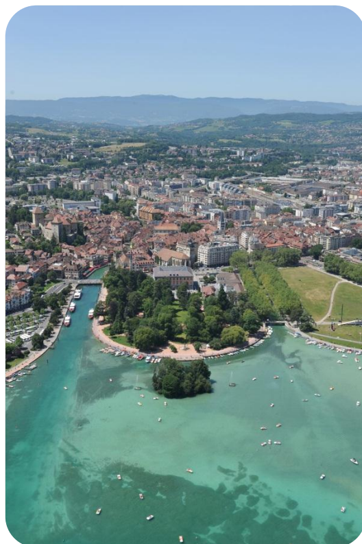
Vue aérienne du Lac d'Annecy

L'idée de faire le parcours de l'Étape du Tour a éveillé une véritable compétition au sein de la Mairie. Les membres du personnel bien sûr mais aussi les élus, parmi lesquels Gilles Bernard, avec lequel j'ai eu le bonheur de remporter trois titres de champion du Monde de canoë-kayak. Alors oui, même si je risque d'être le plus mal entraîné du peloton, je vivrai cette course de l'intérieur !